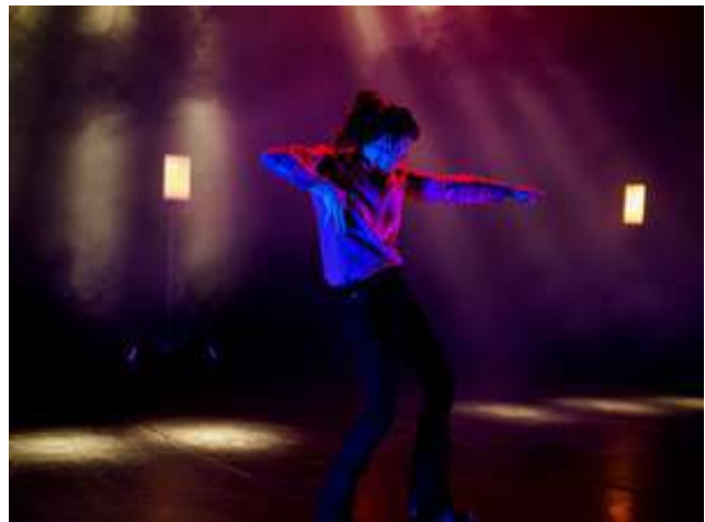
Danse 1 John Travolta