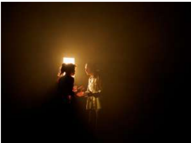
Scène 3 Salle de traite