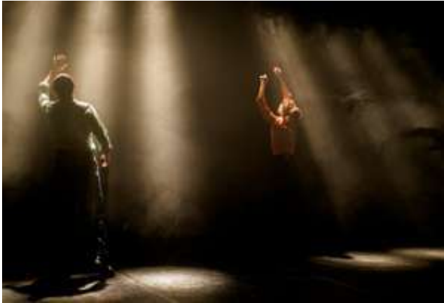
Chanson 1 Bonjour

Photos du Festival Fragments#10, Le Monfort Théâtre, Paris