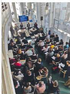
TNB-NOV2019, JOURNÉE AVIS DE TOURNÉES À RENNES

Est-ce la proximité parisienne offerte par la LGV qui incite toujours plus de jeunes équipes artistiques à venir s'installer et développer leur travail en Bretagne ? Nul doute que l'attractivité de l'esprit coopératif breton y est pour beaucoup, ainsi que