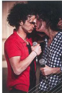
© GROUPE CHEMISSEMENT NANDEGE CATHÉLINAU ET JULIEN FRIGÉ © CHRISTOPHE RAVNAUD DE LAGE

à ses liens avec toutes les parties prenantes du secteur, l'ODIA Normandie agit en facilitateur et accélérateur de coopérations professionnelles. Cette synergie se décline, par exemple, dans les journées maquettes avec le CDN de Normandie Rouen et l'étincelle – Théâtre(s) de la ville de Rouen, le fonds mutualisé d'accompagnement artistique regroupant 9 structures de diffusion, le parcours d'accompagnement coconstruit avec les équipes artistiques ou le dispositif de soutien financier des tournées territoriales de création. Ces actions s'accompagnent d'une attention aux particularités disciplinaires et spécificités des réseaux, et sont constamment réinterrogées dans leur pertinence avec les intéressés.e.s. www.odianormandie.fr