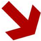
Plate-Forme Interrégionale - 9 mai 2019