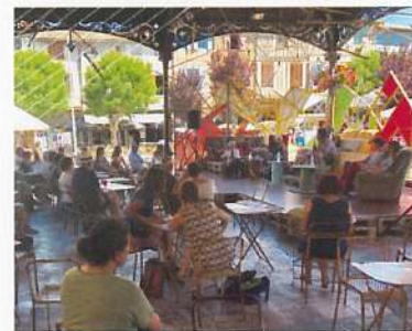
FESTIVAL MIMA 2018 - OCCITANIE EN SCÈNE

Tout au long de la période festivalière, qui se déploie généreusement à la faveur du climat méridional, sont proposés des temps de réflexion et de découvertes artistiques appuyées par Occitanie en scène, plus d'une dizaine chaque année, débutant au Printival Bobby Lapointe (34) pour la chanson francophone et se terminant autour de l'émergence artistique avec le Super Nova du Théâtre Sorano (31). Les festivals sont aussi partie intégrante de l'accompagnement des filières. Ainsi avant la trêve aoûtienne, MIMA (09) sera l'une des escales du Sodam (Schéma d'orientation pour le développement des arts de la marionnette).